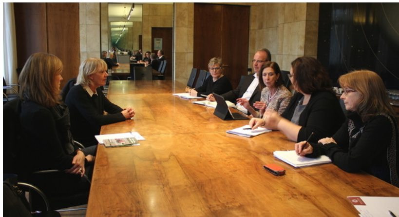
Entrevue de Lydia Mutsch avec l'ASBL Trauerwee

En date du 1 er février 2017, la ministre de la Santé, Lydia Mutsch, a rencontré les représentants de l'ASBL Trauerwee. Créée en 2014, Trauerwee est portée par le principe d'entraide et de soutien à la progression personnelle en cas de deuil.